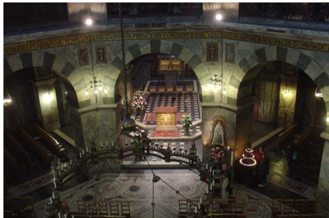
Innenraum des Aachener Domes

In Anbetracht des Tagungsortes wird ein besonderer Schwerpunkt der Veranstaltung bei den antiken Heilbädern (aller römischen Provinzen und Italiens) liegen. Mit Absicht wurde das Thema nicht explizit auf die römischen Thermen eingeeengt, damit auch die Frühformen des öffentlichen Badewesens, sowie die Spätformen (inkl. des Fortlebens römischer Badeanlagen im westlichen, byzantinischen und islamischen Mittelalter) thematisiert werden können.