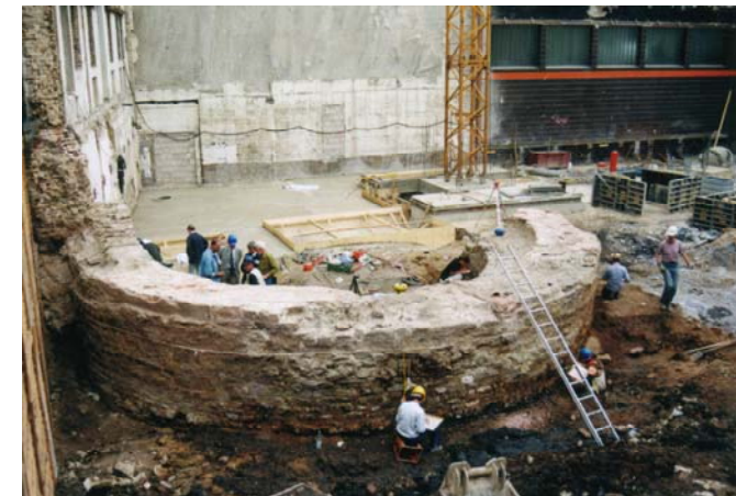
Piscina der Aachener Büchelthermen in situ im Jahr 2001: Grabung und Vorbereitung zur Bergung der Apsisfragmente

aachen tourist service e.v. DVGW figawa / rbv Kur- und Badegesellschaft mbH Österreichisches Archäologisches Institut STAWAG