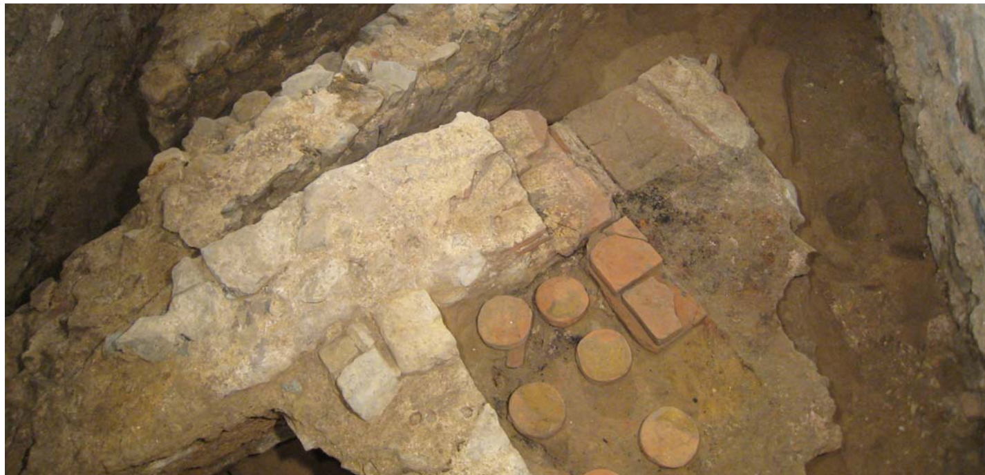
Laufende Domgrabung: Überreste der sogenannten „Herberge“, die unmittelbar an die Münsterthermen angebaut ist

Das Symposium wird seit dem Jahre 2007 durch eine Arbeitsgruppe vorbereitet, der Vertreter der Frontinus-Gesellschaft e. V., der RWTH Aachen (Lehrstuhl für Alte Geschichte), des Landschaftsverbands Rheinland (Bodendenkmalpflege), der Stadt Aachen (Stadtarchäologie), der Stadt Heerlen/NL (Thermenmuseum) und der Stadt Zülpich (Museum der Badekultur) angehören.