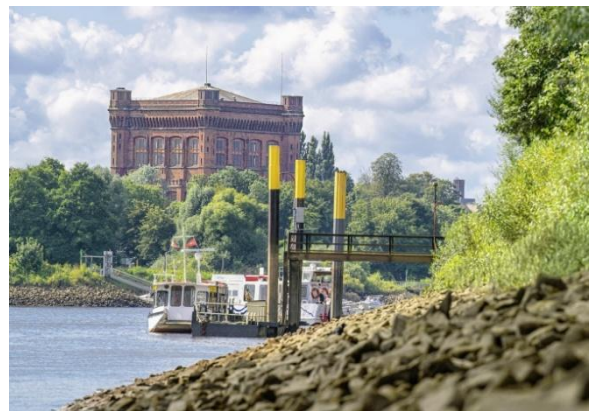
Umgedrehte Kommode

Wir werden bei diesem Rundgang auch die „Umgedrehte Kommode“ besichtigen. Es handelt sich um einen alten Wasserturm. Seinen Spitznamen „Umgekehrte Kommode“ bekam dieses Bauwerk, weil seine vier Türme wie die Beine einer Kommode aussehen, die auf dem Kopf steht.