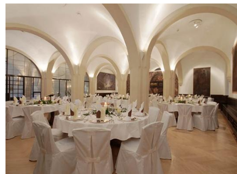
Ratskeller Hauffsaal

Als Teil des Rathauses gehört auch der Ratskeller zum UNESCO Weltkulturerbe.