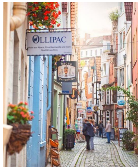
Schnoor © WFB / Carina Tank (Ausschnitt)

10.00 - 12.00 Uhr: Wir treffen uns am „Roland“ zur Stadtführung