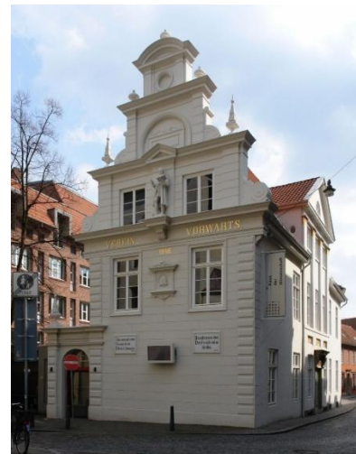
Haus der Wissenschaft

Das Haus der Wissenschaft bietet spannende Einblicke in die Arbeiten der Universitäten, Hochschulen und Forschungsinstitute im Land Bremen und dient der Kommunikation mit der Bevölkerung. In den letzten Jahren wurde im Land Bremen ein großes Forschungspotenzial aufgebaut. Zwei Universitäten, drei Hochschulen sowie hoch angesehene Forschungsinstitute prägen eine lebendige Wissenschaftslandschaft.