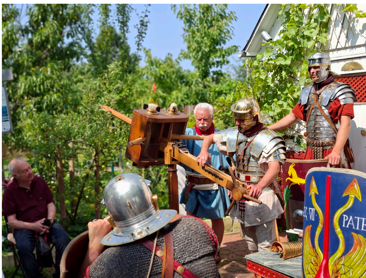
Legio XXI Rapax

Die außerordentlich gefragte Reenactmentgruppe Legio XXI Rapax ist regelmäßig bei Großereignissen wie in Kalkriese oder im Römerlager Anreppen (Stadt Delbrück) zu sehen. Dort stellen sie das Leben der römischen Legionäre nach. Sehr detailgenau und außerordentlich fundiert. Wir freuen uns daher sehr, dass sie für uns auch in diesem Jahr wieder einen Termin frei schaufeln konnten.