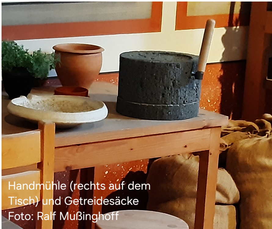
Handmühle (rechts auf dem Tisch) und Getreidesäcke

Vortrag von Ralf Mußinghoff (Augustus Gesellschaft)